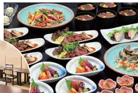
和中西ミックスコース